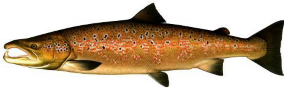
Lax, Salmo salar